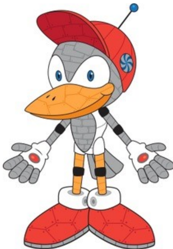
Lovrobot (narisal Nejc Kolarič, 9. razred)

Za učence 1., 3., 6. in 8. razreda so organizirani sistematični pregledi, za učence 1. in 8. razreda je organizirano cepljenje. Prav tako so organizirani sistematični pregledi zob in učenje pravilnega čiščenja in nege zob.